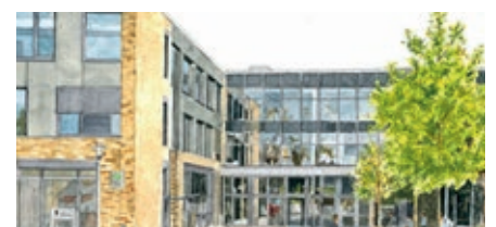
oben: Die Silhouette der Weststadt, gemalt von Piotr Wreczycki, ist das Titelbild des Kalenders.