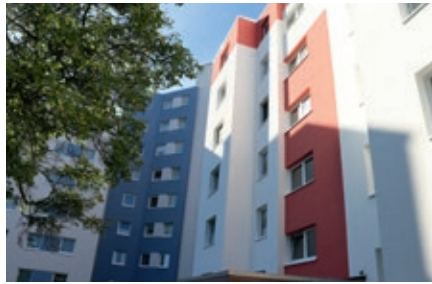
Die Wohnhäuser sahen vor der Sanierung trist grau aus. Nach der Sanierung wirken die Gebäude aufgrund der Farbgebung deutlich freundlicher.

so gesteuert, dass der erforderliche Wärmebedarf gut gedeckt ist, aber nicht in erheblichem Umfang darüber hinaus, wie dies teilweise gerade im Übergang der Jahreszeiten bisher der Fall war. Von dieser Steuerung sehen unsere Mieter nichts. Sie merken dies im ersten Zug vielleicht nur, weil die Heizkörper bzw. Rohrleitungen nicht mehr ständig „kochend heiß“ sind.