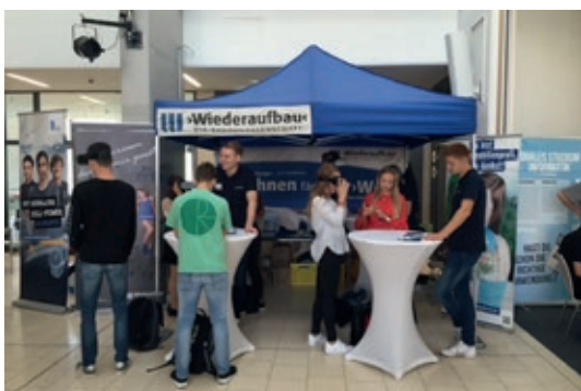
Unser Stand in der Wilhelm-Bracke-Gesamtschule wurde von den Schülerinnen und Schülern sehr gut bewertet.

Am 23. August 2019 nahm die ›Wiederaufbau‹ am JobParcours der Wilhelm-Bracke-Gesamtschule in der Braunschweiger Weststadt teil. Nach dem Motto „Azubis suchen Azubis“ hatten die Schüler der 11. Klassen die Möglichkeit, 15 Unternehmen in einer Art Speed-Dating kennenzulernen. Die Schüler gingen in Gruppen für jeweils 20 Minuten von Unternehmen zu Unternehmen, sollten dort Aufgaben lösen und absolvierten so ihren persönlichen JobParcours. An unserem Stand, der überwiegend von unseren Azubis betreut wurde, mussten sie in Zweiergruppen mithilfe von 360°-Brillen Quizfragen zu