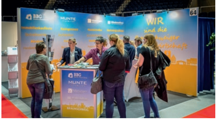
Diese Seite © Wiederaufbau

Vor einer tollen Messestand-Kulisse führten wir gute Gespräche mit den Besuchern und informierten über die vielfältigen Aufgaben und Tätigkeiten bei uns im Unternehmen. Fazit: Unser Messeauftritt war ein voller Erfolg! (sk)