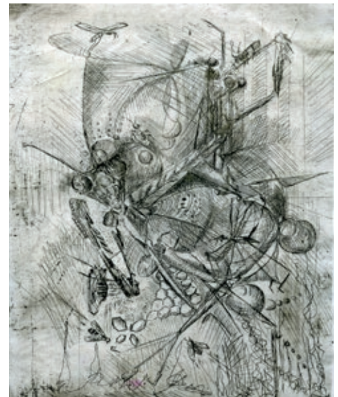
Linkes Bild © Wiederaufbau © BBK